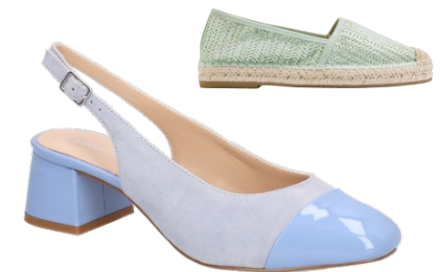
SLINGBACK aus Veloursleder mit Lackspitze, um €69,95 erhältlich bei HUMANIC