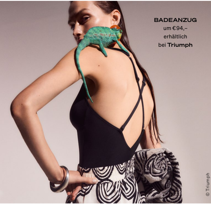
BADEANZUG um €94,- erhältlich bei Triumph