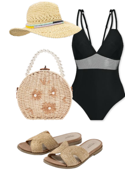
STROHHUT um €19,95 erhältlich bei Bijou Brigitte