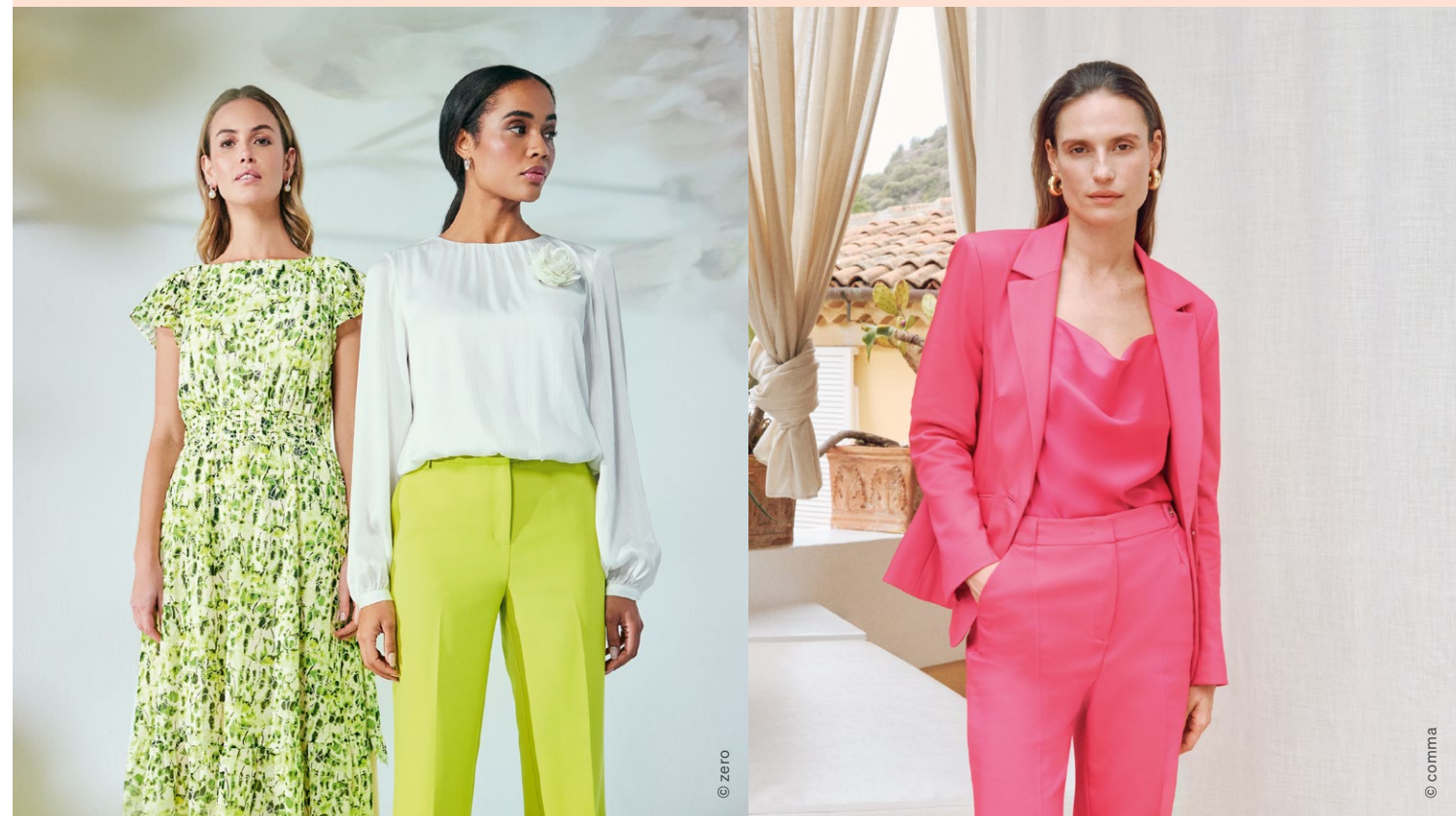
KLEID um €119,99 BLUSE um €59,99 HOSE um €79,99 erhältlich bei zero / HOSE um €99,99 BLAZER um €159,99 erhältlich bei comma