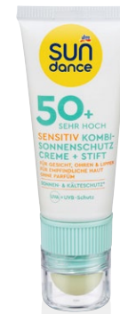
SONNENCREME fürs Gesicht, LSF 50, von sundance, um €4,45 erhältlich bei dm