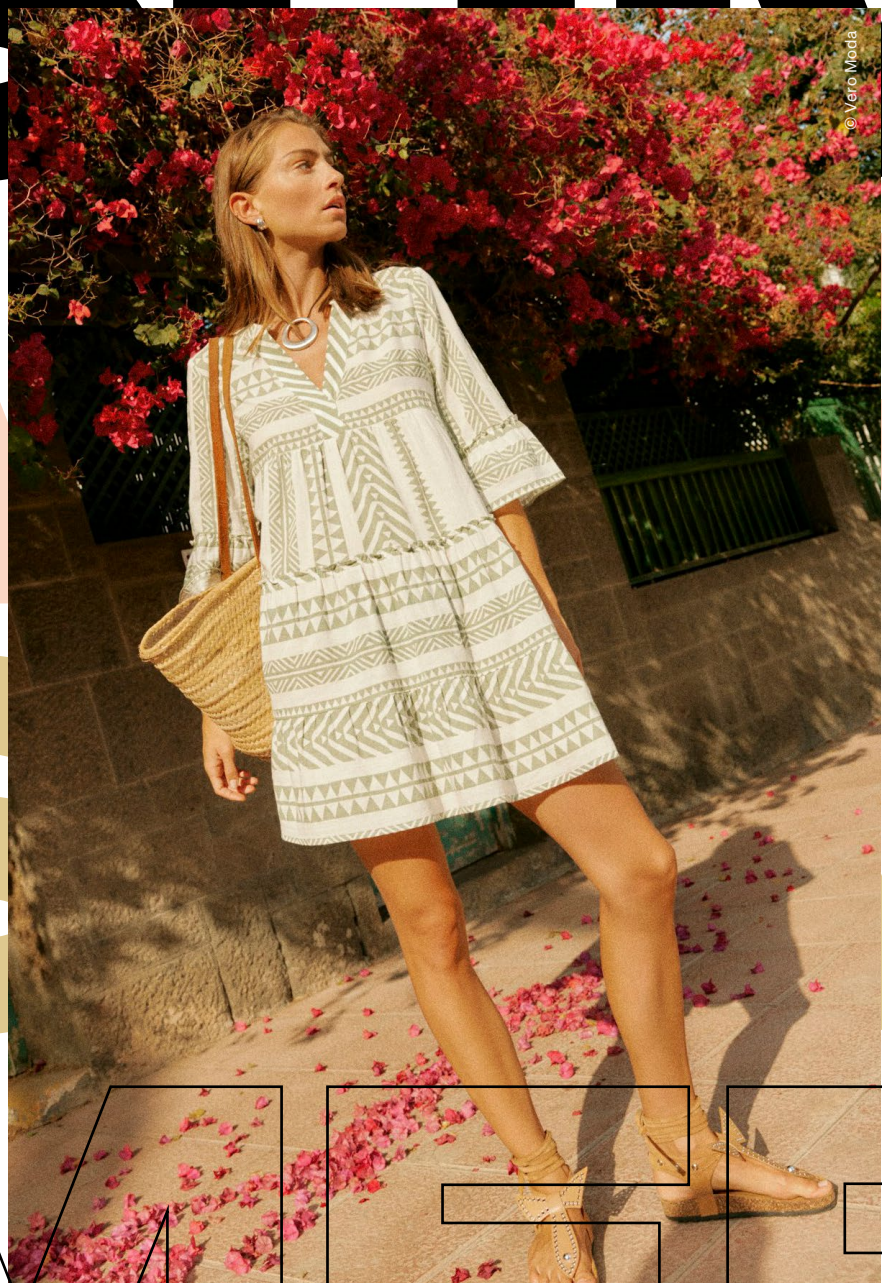
KLEID midi, um €39,99 erhältlich bei Verò Moda TASCHE geflochten, lange Träger, um €44,99 erhältlich bei Verò Moda